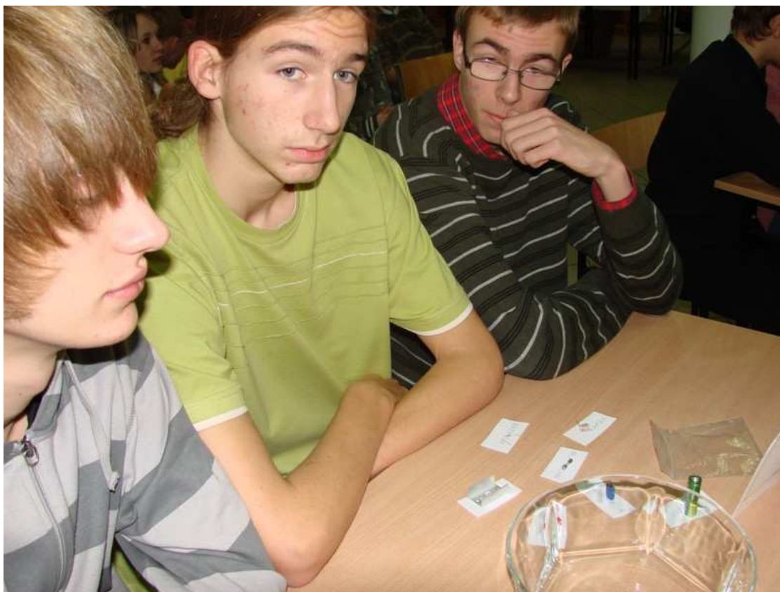
Wyróżniona drużyna z Gimnazjum nr 11