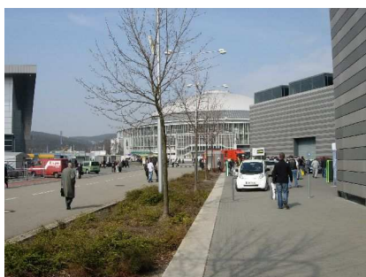
Tereny targowe BVV Brno

Równocześnie miały miejsce również Targi Technologii Optycznych i Aplikacji OPTONIKA .