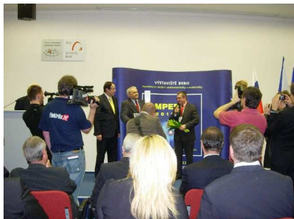
Uroczystość Golden AMPER Wręczenie nagrody ZPUE Włoszczowa

W dniu 29 marca 2011 r. odbyła się tradycyjna, uroczysta ceremonia GOLDEN AMPER , w czasie której wręczane są nagrody Złotego AMPERA dla najlepszych wyrobów prezentowanych na targach. I tu spotkała nas bardzo miła niespodzianka, ponieważ jedną z nagród otrzymała polska firma ZPUE Włoszczowa za rozdzielnicę Rotobloc VCB .