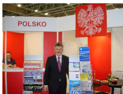
Stoisko SEP i WPHiI – P. Janusz.Nowastowski – PIGE

Stoisko SEP, połączone było ze stoiskiem Wydziału Promocji Handlu i Inwestycji Ambasady RP w Pradze .