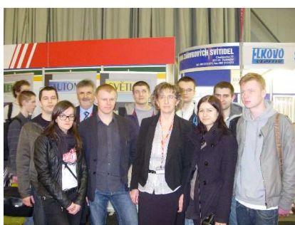
Uczestnicy wyjazdu SEP